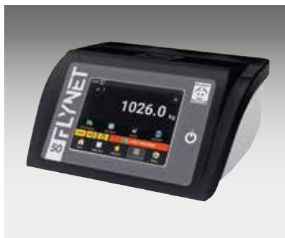
FLYNET TERMINALE DI PESATURA TOUCH SCREEN