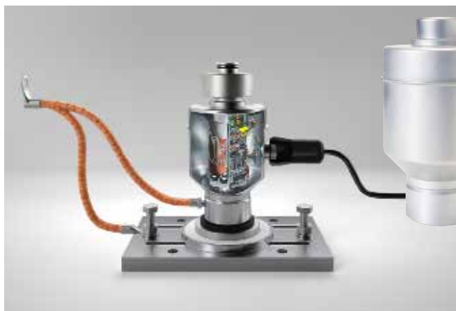
CPD CELLA DI CARICO DIGITALE