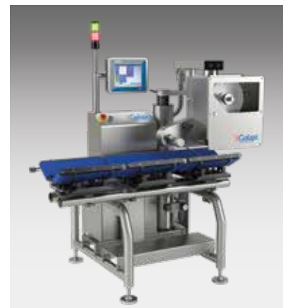
SISTEMI DI PESOPREZZATURA, ETICHETTATURA E CONTROLLO